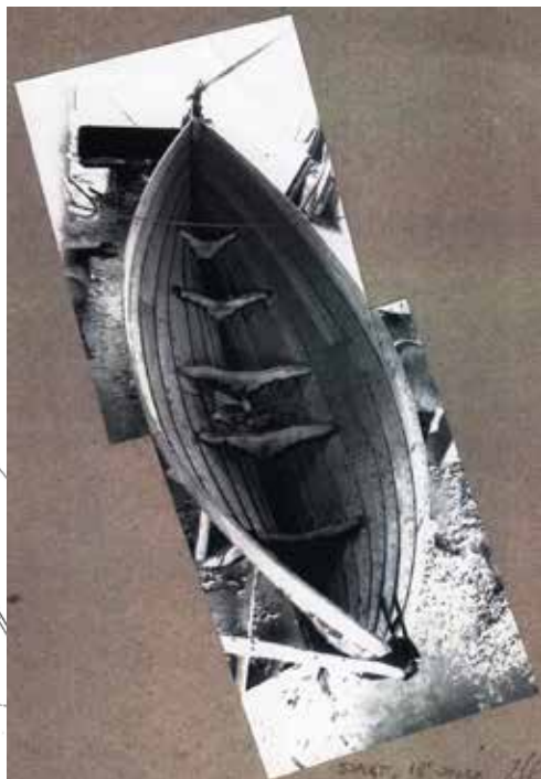
Design og bygning af træskibe.

En omtegnet Limfjordssjægt med rigtig gode sejlegenskaber. Bygget fra bunden og sejlet i rigtig mange år. 1985